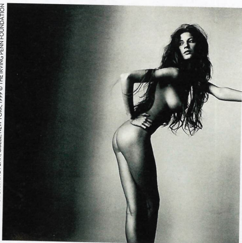
GISELE, NEW YORK, 1999