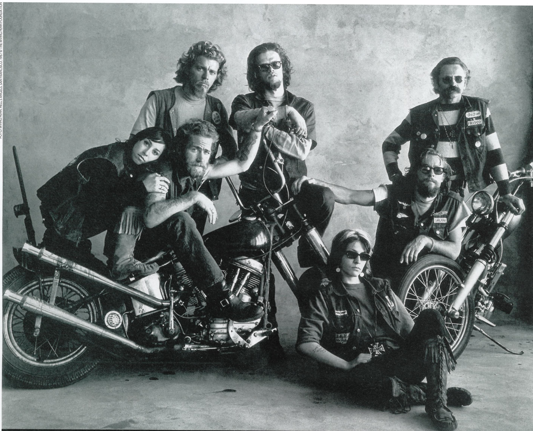
VARJE KOPIA UNIK. Irving Penns fotografier av Hells Angels, en modebild för Vogue, Miles Davis hand, Ingmar Bergman, Gisele Bündchen och hustrun Lisa Fonssagrives-Penn visas i september på Åmells konsthandel i Stockholm. Innan han gick bort 2009 förstörde Irving Penn alla sina negativ.