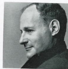
Irving Penn, 1960.