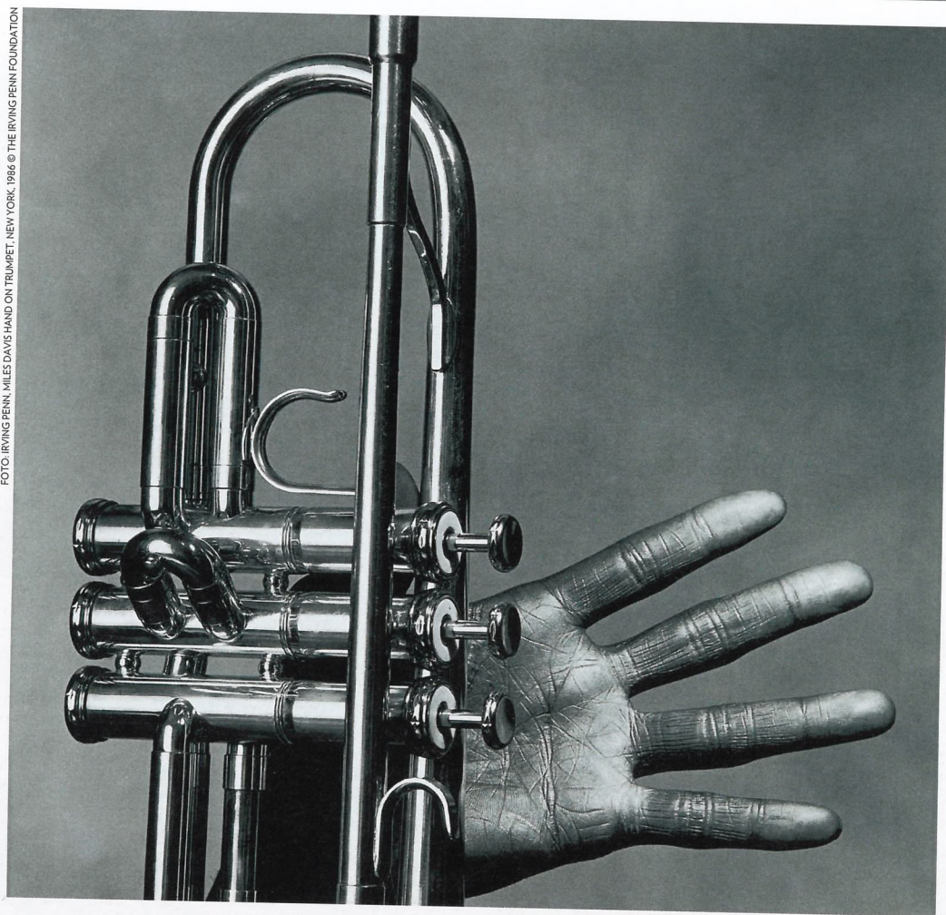
FOTO: IRVING PENN, MILES DAVIS HAND ON TRUMPET, NEW YORK, 1986 © THE IRVING PENN FOUNDATION