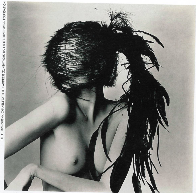
FOTO: IRVING PENN, CHANEL FEATHER HEADRESS (B), NEW YORK, 1994 © THE IRVING PENN FOUNDATION