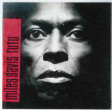
Miles Davis Tutu från 1986.

»Miles var väldigt motvillig till att ställa upp, men när fotosessionen var över kom han fram till min far och kysste honom på munnen.«