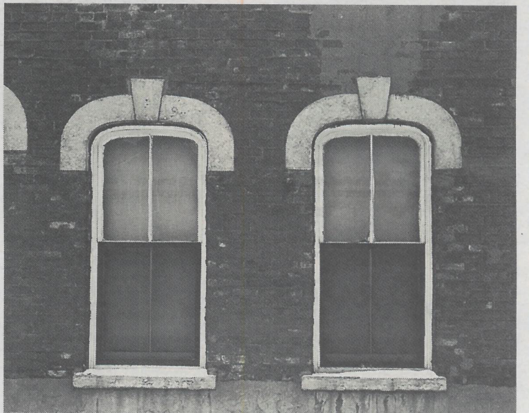
... och även "Chicago" av Harry Callahan, 1949. Foto: The estate of Harry Callahan