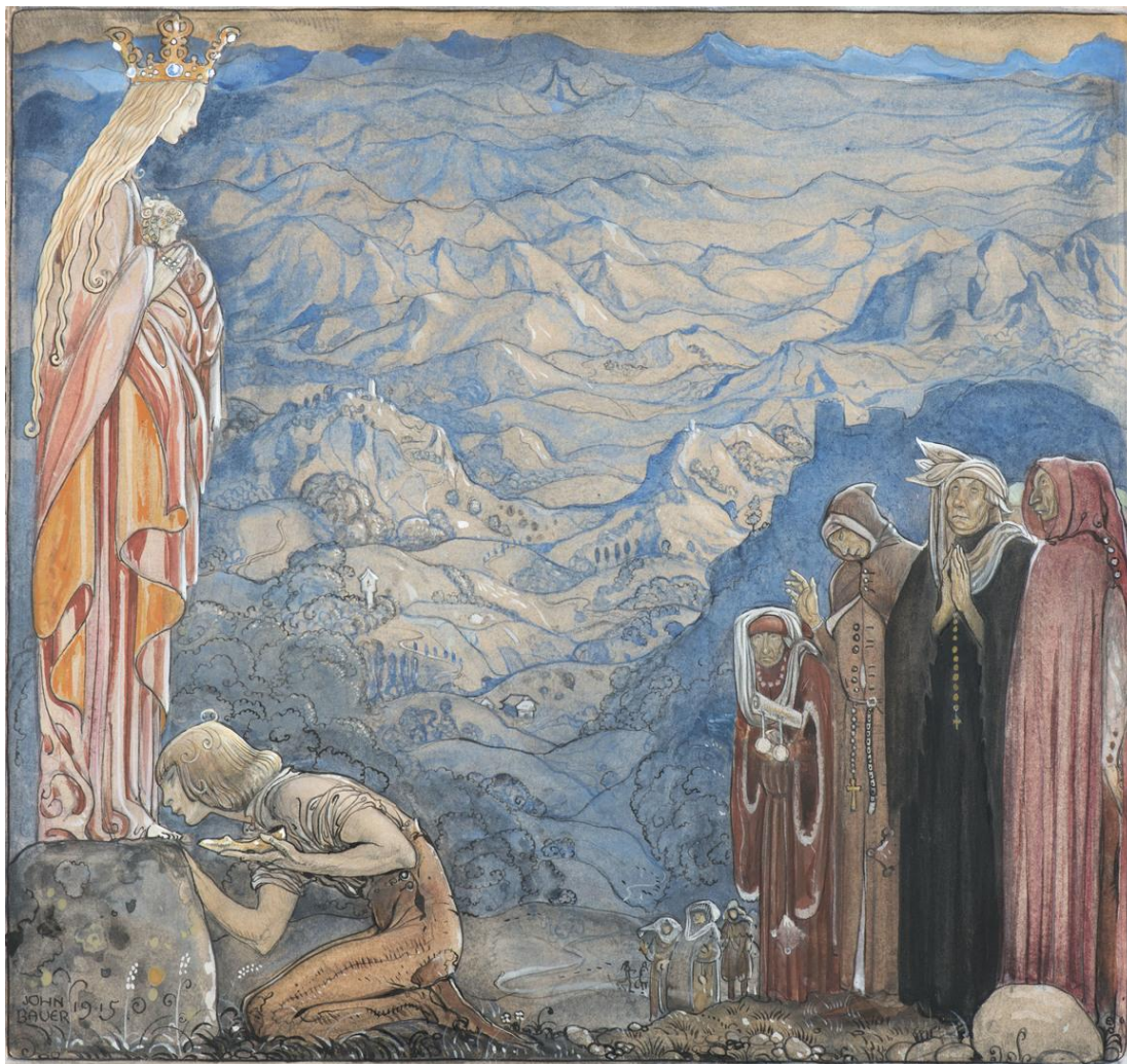
John Bauer, Spelmannen kysser madonnans bara fot , 1915. Akvarell, blyerts och täckvitt, 27 x 28,5 cm