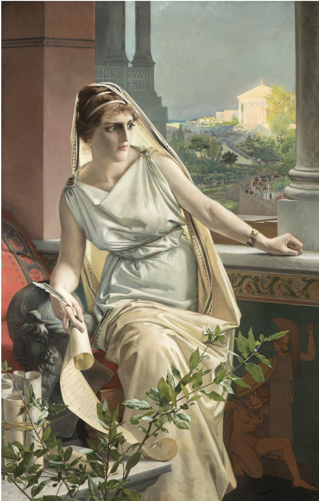
Julius Kronberg, Hypatia , 1889. Olja på duk, 173 x 111 cm